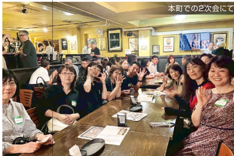
本町での2次会にて

人の数だけ人生があります。60年近く生きてきた中のたった3年間。あの密度の濃い時間を一緒に過ごした仲間は、顔を見ると一瞬にしてあの時へタイムトリップ出来るのはとても幸せだ