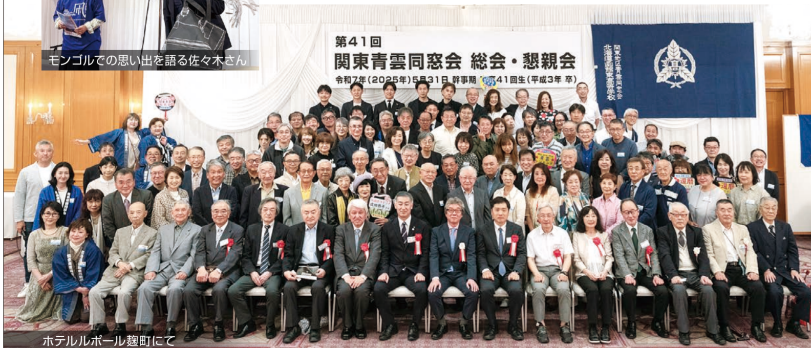
ホテルボールルームにて