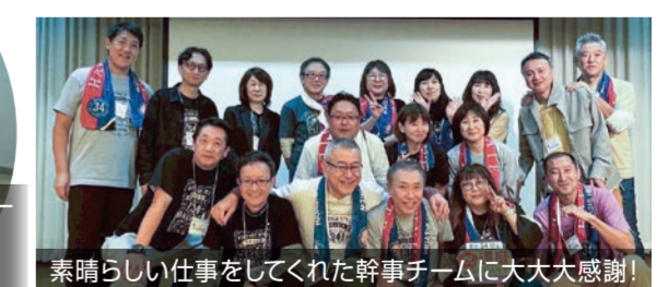
素晴らしい仕事をしてくれた幹事チームに大大大感謝!