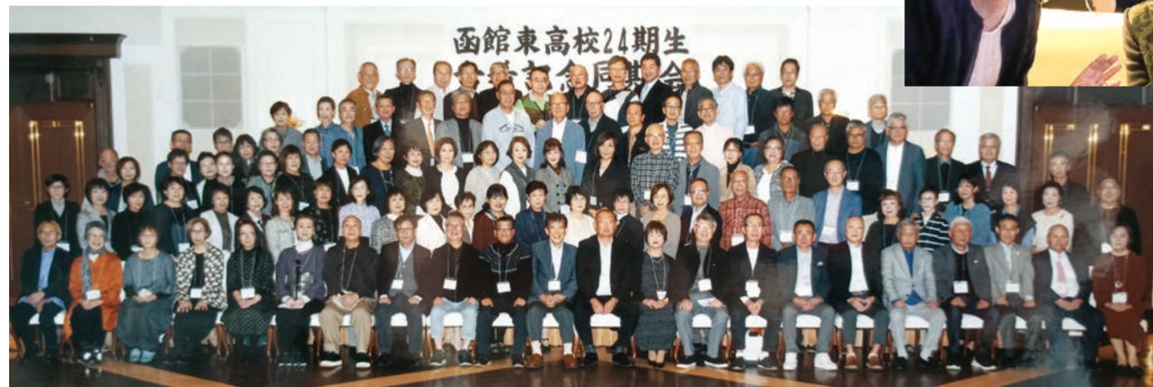
函館東高校24期生 古希同期会

2025年10月19日(日)、ベルクラシック函館(五稜郭)で古希同期会を開きました。参加者数は106名。