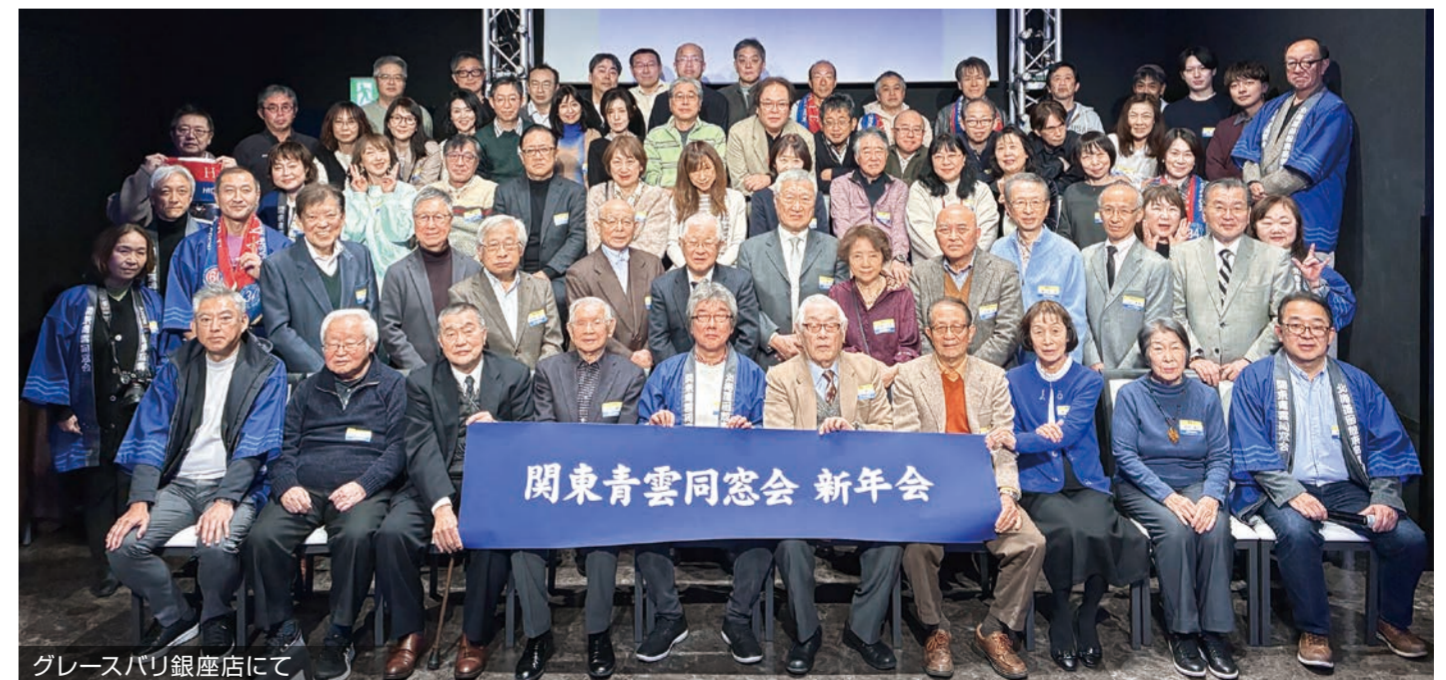
グレースバリ銀座店にて