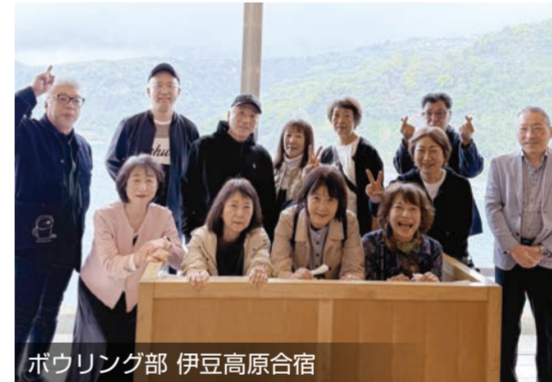
ボウリング部 伊豆高原宿

また、昨年10月に函館で行われた4年遅れの還暦会は一大イベントだった。2019年の函館写真部との集まりで話題になったのがスタートだがコロナ渦で断念。すでに還暦を4年過ぎて