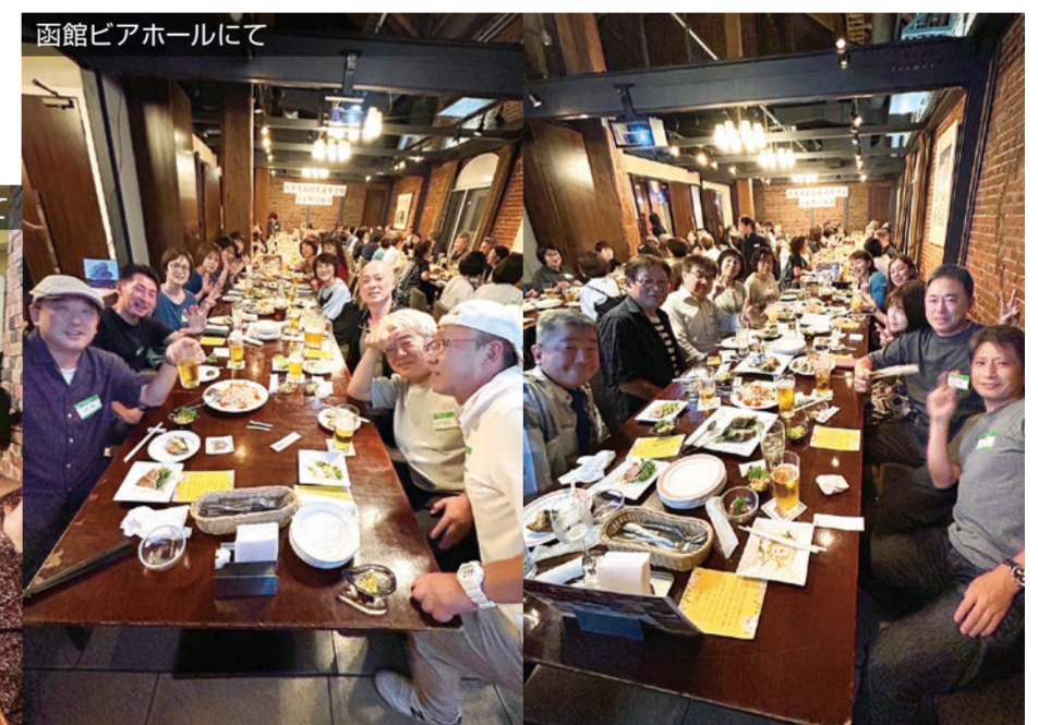
函館ビアホールにて

と思います。次は2年後。還暦同期会を予定しています。それまでみんな健康で過ごしましょう。