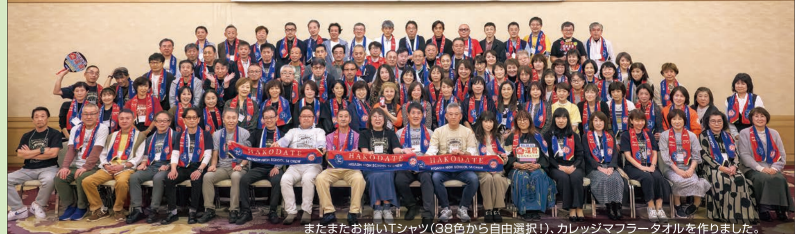
またまたお揃いTシャツ(38色から自由選択!), カレッジマフラータオルを作りました。