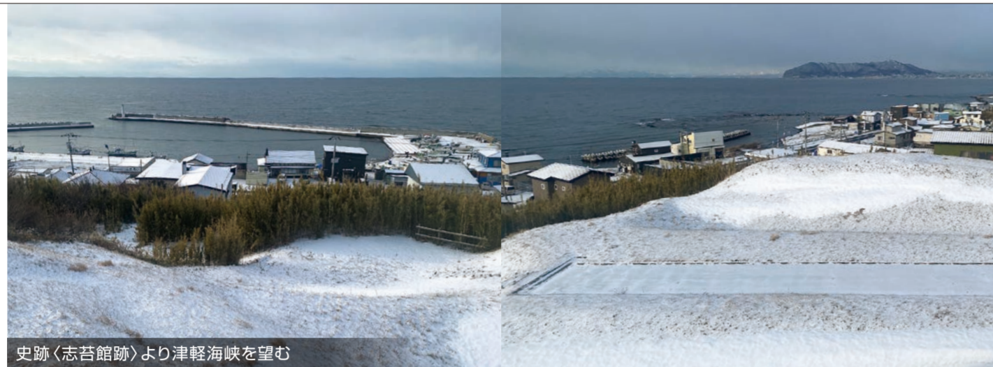
史跡〈志苔館跡〉より津軽海峡を望む