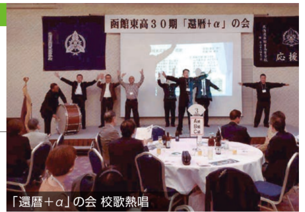
「還暦+α」の会 校歌熱唱

αの会と名付けた。幹事は函館在住者を中心に札幌と関東からも選出、自分は関東幹事の一人だった。