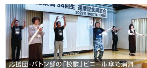
応援団・バンド部の「校歌」ビニール傘で演舞