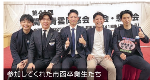
参加してくれた市函卒業生たち

参加者が増えてきたこともあって、 最後に全員が酔いしれて歌う校歌に 「市立函館高校校歌」も加わり、私の 目には「市中→市高→東高→市函」 と母校の歴史が脈々と引き継がれて いるように映りました!