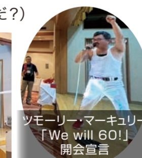
ツモーリー・マーキュリー 「We will 60!」 開会宣言