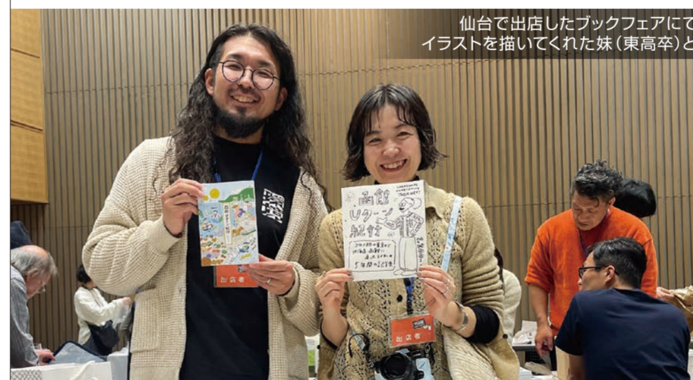
仙台で出店したブックフェアにて。イラストを描いてくれた妹（東高卒）と。